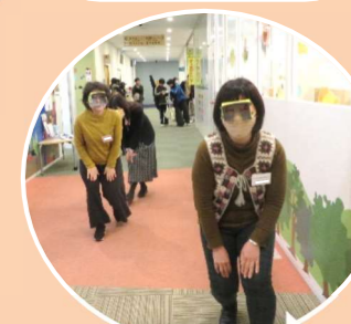
チャイルドビジョンで 子どもの視野を体験