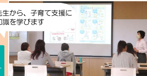
専門の先生から、子育て支援に 必要な知識を学びます