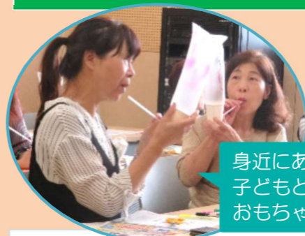
身近にある材料で 子どもと遊べる おもちゃを作ります