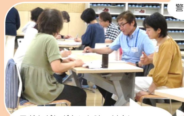
警察署の方の交通安全指導